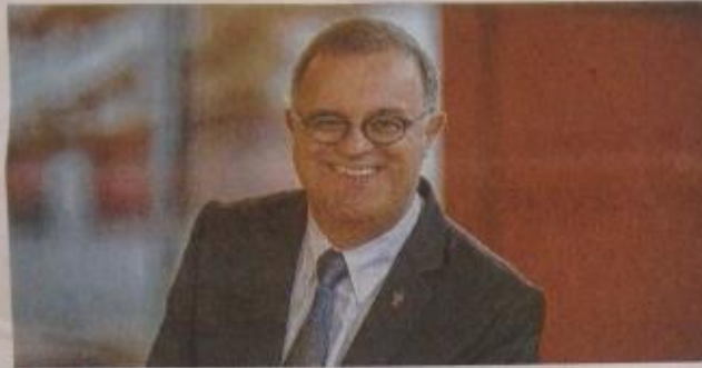
Meinungsaustausch: Landesbischof Frank Otfried July spricht zum Thema „Sozial nachhaltige Unternehmensführung“.